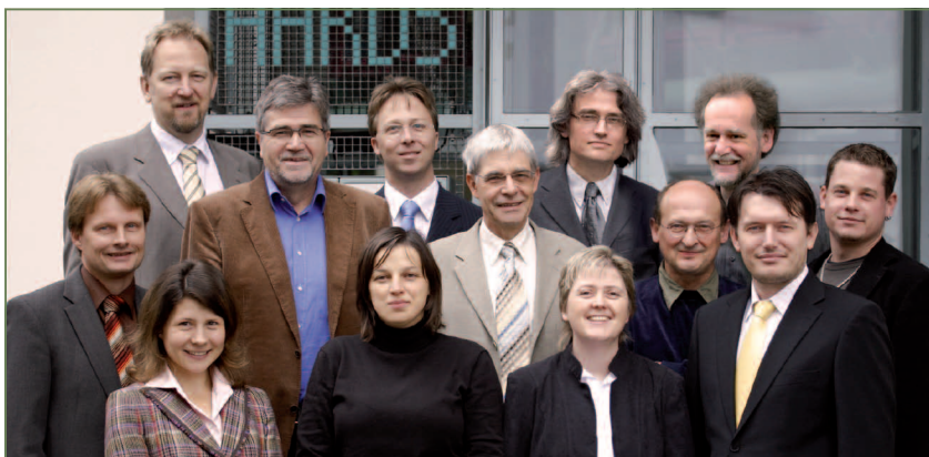
Ein engagiertes Team aus 15 Mitarbeitenden mit insgesamt über 120 Jahren Spezialistenerfahrung sorgt für Prozessintegration mit einem ganzheitlichen Ansatz.

Zwei Dinge lagen uns von Anfang an am Herzen: Einerseits wollten wir Praxiserfahrungen in Standardmethoden gies-sen,